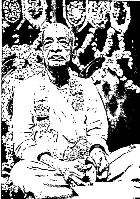
कृष्णव्याधीर्मान श्री श्रीमद ए मी श्रीरत्नवदान स्वामी प्रभसाद महापकाचार्य अन्तरराष्ट्रीय श्रीकृष्णधारनामृत मंत्र तथा पश्चिमी जगत् मे श्रीकृष्णधारनामृत क मन्त्र महान प्रणिसादक।